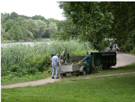
Gewässerdienst am Kupferteich, beladen eines Grünabfall Containers.

Heute hat jedes Vereinsmitglied an 3 von 5 angebotenen Terminen seinen Gewässerdienst zu leisten. An diesen Tagen treffen sich die Mitglieder und können sich bei einem Imbiss zum Abschluß über ihr Hobby austauschen.