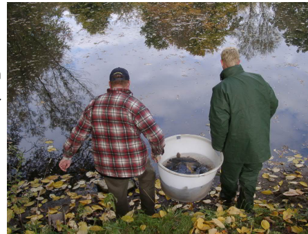
Fischbesatz durch Vereins Mitglieder

Der jährliche Fischbesatz in den Pachtgewässern wird nach der guten fachlichen Praxis fischereilicher Besatzmaßnahmen durchgeführt. Es werden nur nicht fangfähige und gesunde einheimische Fische eingesetzt. Dazu zählen auch Fische die unter Artenschutz stehen und nicht beangelt werden dürfen. Die Kosten für den Besatz trägt der Verein.